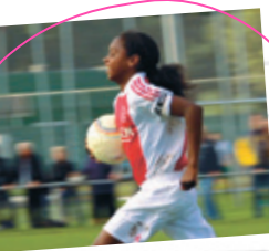
▶ DE PRIJS VAN DE HEMEL

DE PRIJS VAN DE HEMEL DER PREIS DES HIMMELS NL-2012 | 59 min Deutsche Erstausführung Jack Janssen