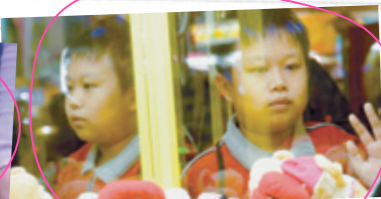
▶ GRADY SANG PENYEMBUH