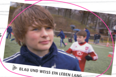
▶ BLAU UND WEISS EIN LEBEN LANG